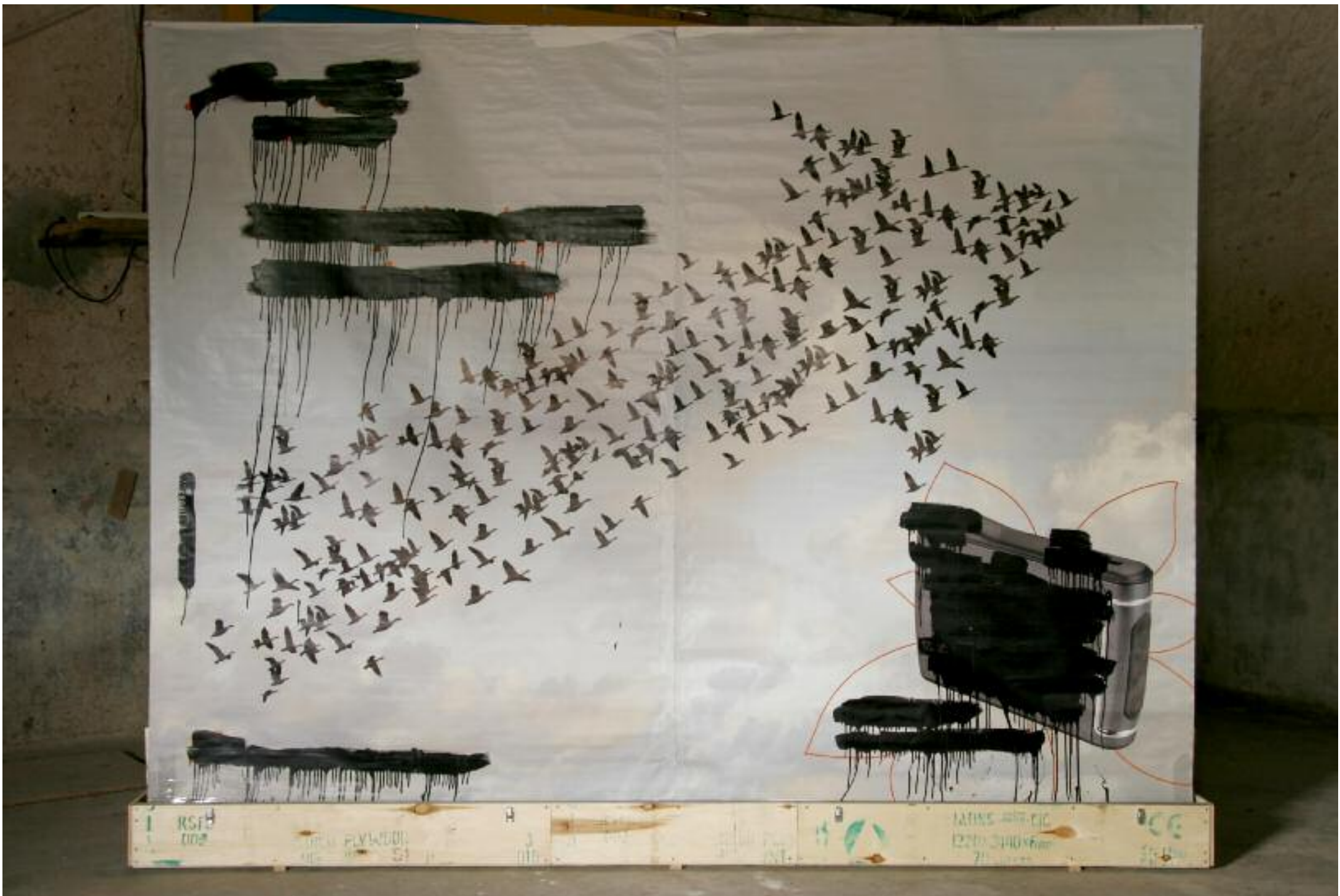
maxi sans-lire "n°7168" boîte de 320cm x 20 x 20 (ouverte 320cm x 240 x 20)