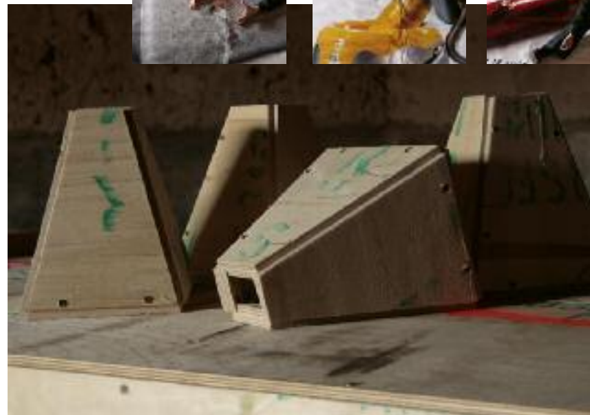
"à ne pas mettre entre toutes les mains" 17cm x 15 x 13