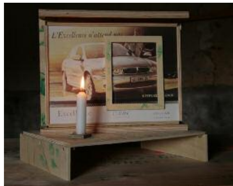
"icône d'avant... 2008" 32cm x 30 x 24